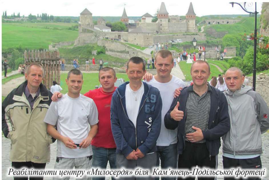
Реабілітанти центру «Милосердя» біля Кам'янець-Подільської фортеці

Віталій ДОПТЮХ, Тернопіль-Новодністровськ