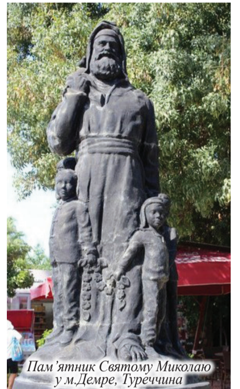
Пам'ятник Святому Миколаю у м.Демре, Туреччина

Серед залишків настінних розписів в тій-таки церкві Святого Миколая ми побачили знайому всім віруючим людям «рибку». Цей християнський символ завжди асоціювався у моїй свідомості з тим фактом, що першими учнями Ісуса стали рибалки. Зустрівшись з ними на березі моря, Господь покликав їх за Собою, щоб зробити «ловцями людей». А гід-мусульманин розповів ще одну версію походження цього знака: перші букви слів Ісус, Христос, Син, Божий, Спаситель у грецькій мові складають абрєвіатуру, яка читається «іхтіс» і означає «риба». Це було для мене цікавим відкриттям серед багатьох інших, якими почастивав нас з дочкою сонячний день у гостинній Туреччині.